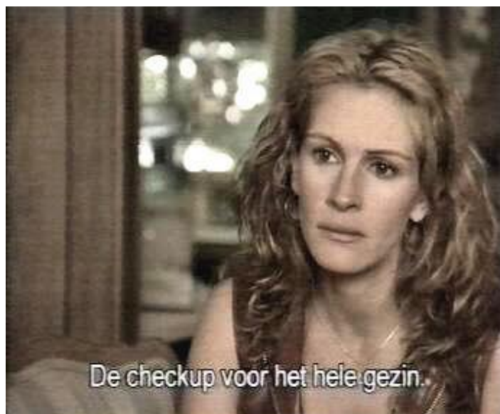
Erin Brockovich over Chroom-VI in ons drinkwater