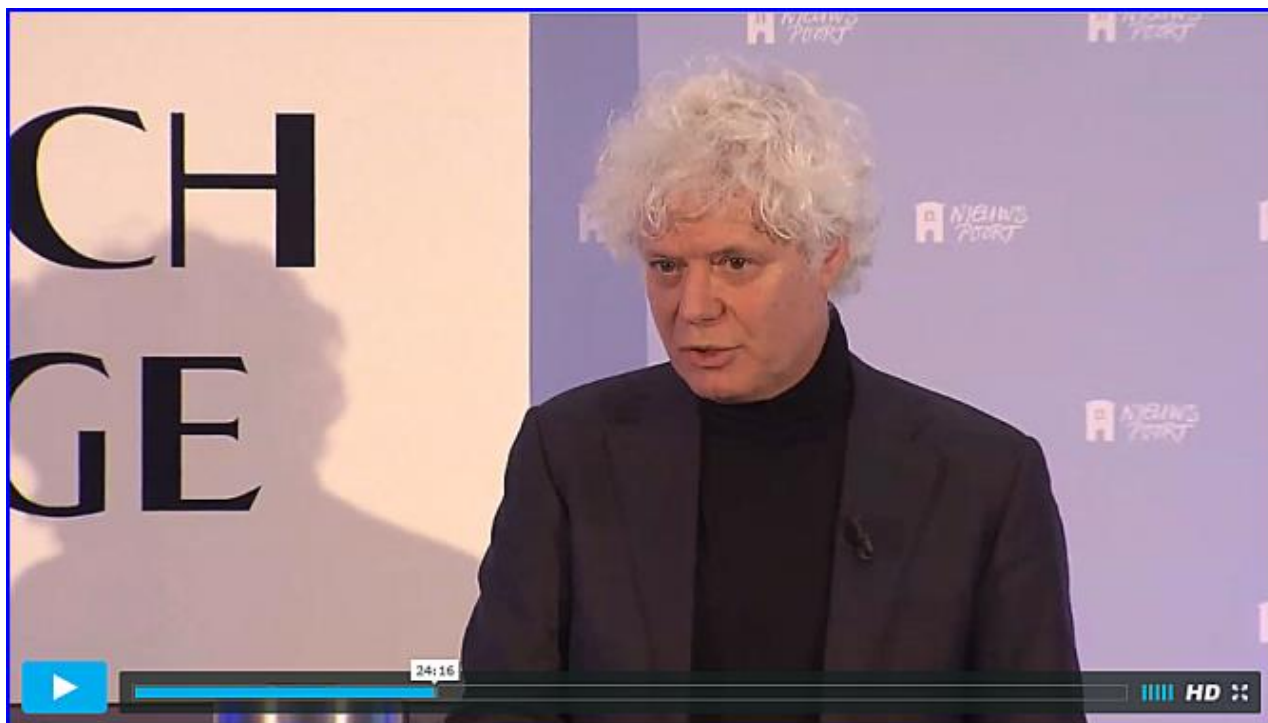
Paul Scheffer gaf de juiste oplossing voor het vluchtelingen- en migratieprobleem; een soort Marshallhulp

Verzoek aan de redactie van het Haagsch College: publiceer ook mijn lezing op Politiek 24