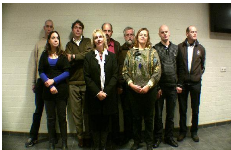
De kandidaten voor de gemeenten Sint-Oedenrode en Heusden