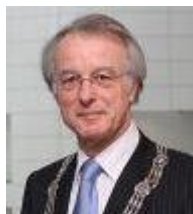
Geacht college van burgemeester en wethouders van Den Haag.

Aan burgemeester Jozias van Aartsen en wethouders van de gemeente Den Haag