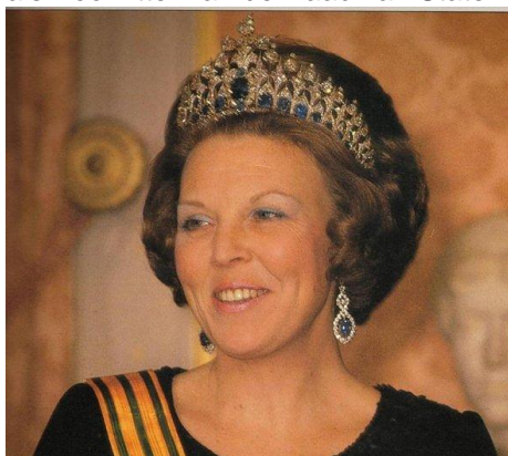
Kneuterdijk 22, 2514 EN Den Haag

Verstuurd per fax Fax: 070 - 3651380 Aan Hare Majesteit de Koningin Beatrix als Voorzitter van de Raad van State