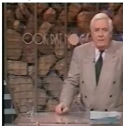
Ook Dat Nog uit 1993

Bekijk ook de 10 Nederlandse TV-uitzendingen hieronder: