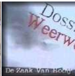
Slepende zaak v. Rooij