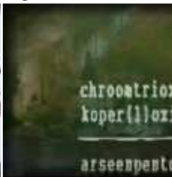
Valse Hickson rapport